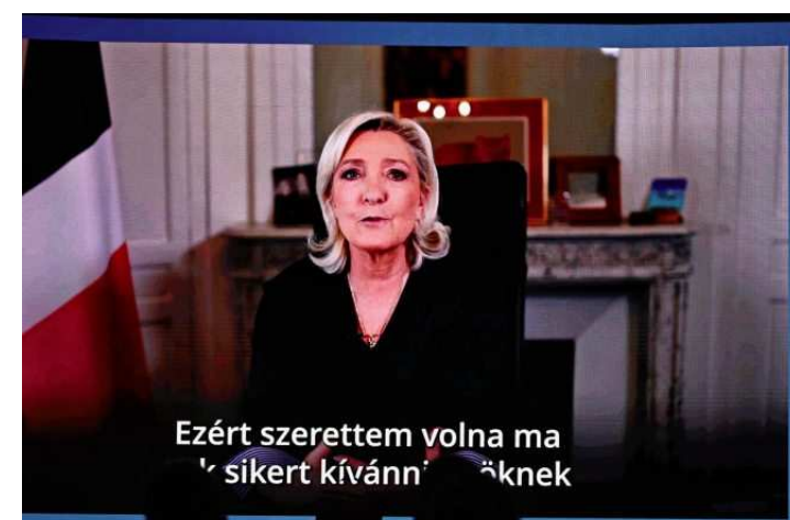
Mit Liebesgrüssen aus Paris: Marine Le Pen wirft sich im Wahlkampfvideo für Viktor Orbán in Pose.

Wie berechtigt solche Hoffnungen sind, ist eine ganz andere Frage. Im Wahlkampf gibt sich der 44-jährige Anwalt und Ex-Diplomat trotz Fidesz-Vergangenheit als Zentrist, mit starker Ausrichtung auf innenpolitische Themen wie Korruptionsbekämpfung, Verbesserung der Gesundheitsversorgung und Reform des Erziehungssystems. In aktuellen Wahlumfragen führt seine oppositionelle Tisza-Partei mit 45,2 Prozentpunkten vor Orbáns Fidesz mit 42,0 Prozent.